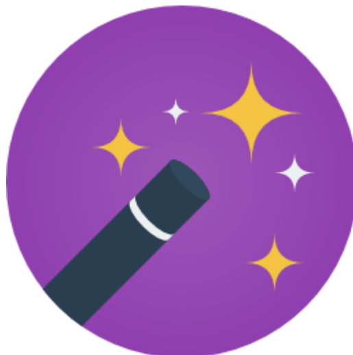
חזרה לחלק ראשון: תכנון מול ביצוע